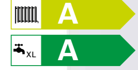
Condens 2500 W Yoğuşmalı Kombi